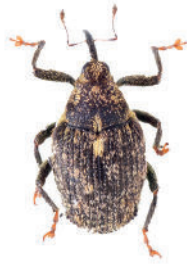
Gefleckter Kohltriebrüßler rotbraun gefärbte Fußglieder "rote Schuhe"