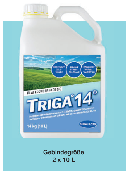
Gebindegröße 2 x 10 L

Mehr unter: Telefon: 08122 - 880 9 880 oder www.sudau-agro.de